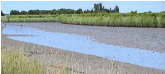
Figura 1: Área de estudio. Ría de la Bahía de Samborombón en que viven los cangrejos violinistas de la especie Leptuca uruguayensis .

Los cangrejos violinistas- llamados comúnmente por la forma de sus pinzas - de la especie Leptuca uruguayensis son crustáceos comúnmente encontrados en las rías y canales asociados a los estuarios bonaerenses (Figura 1).